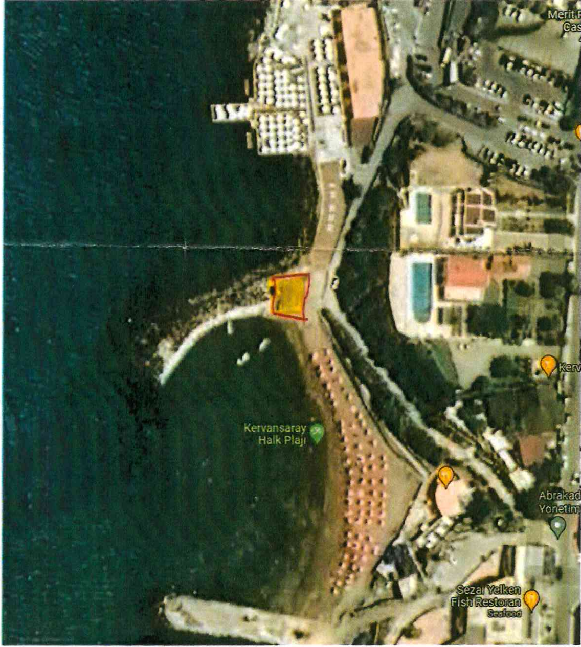
EK-1 : Talebe konu alan uydu fotoğrafı ( sarı ile belirtilmiştir)